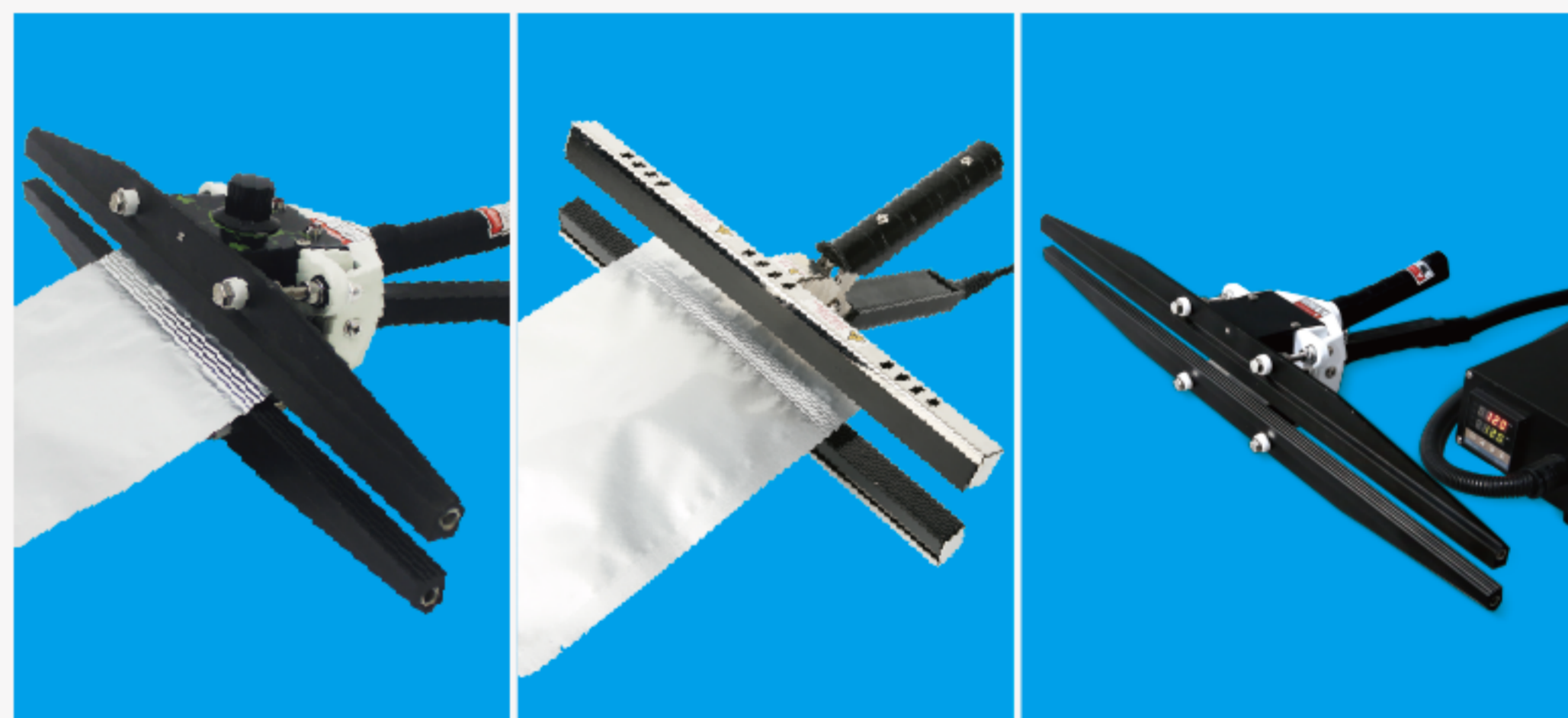
大功率款 FKR手钳封口机